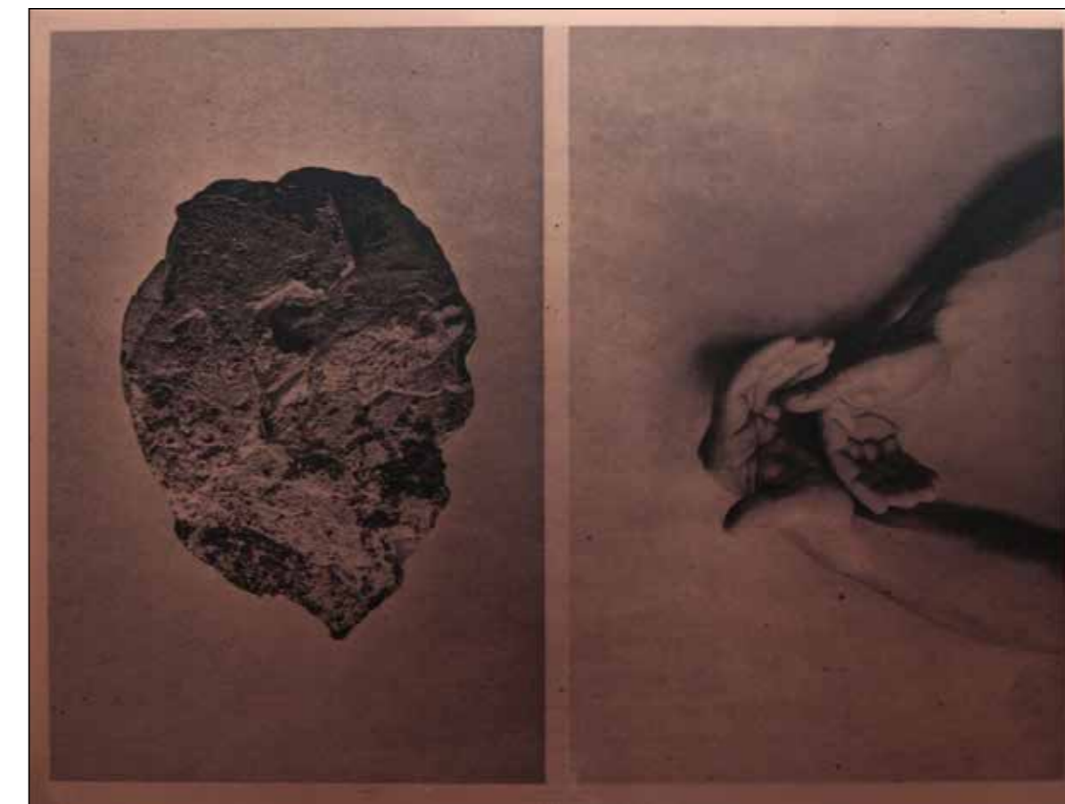
Ilanit Ilouz Bastnäsité, Boussole, série Petra, 2020 Héliogravure sur matrices en cuivre encrées et vernies 20 x 26 cm Oeuvres produites dans le cadre de FLUX, commande photographique du Centre national des arts plastiques (Cnap)