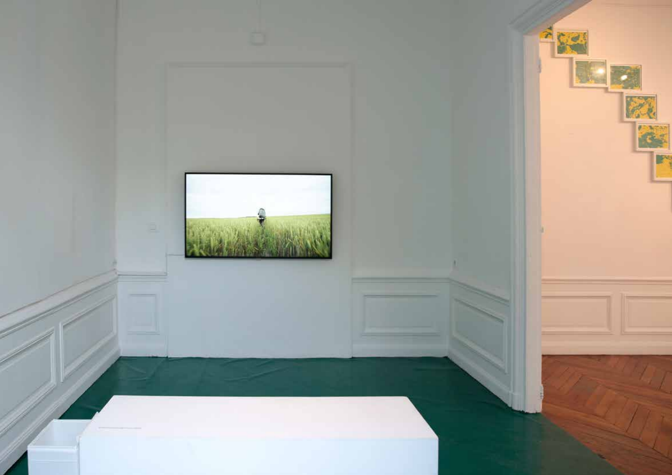
Etienne de France Exploration of a Failure, 2013 Série de dessins, crayons sur papier 29,7 x 21 cm