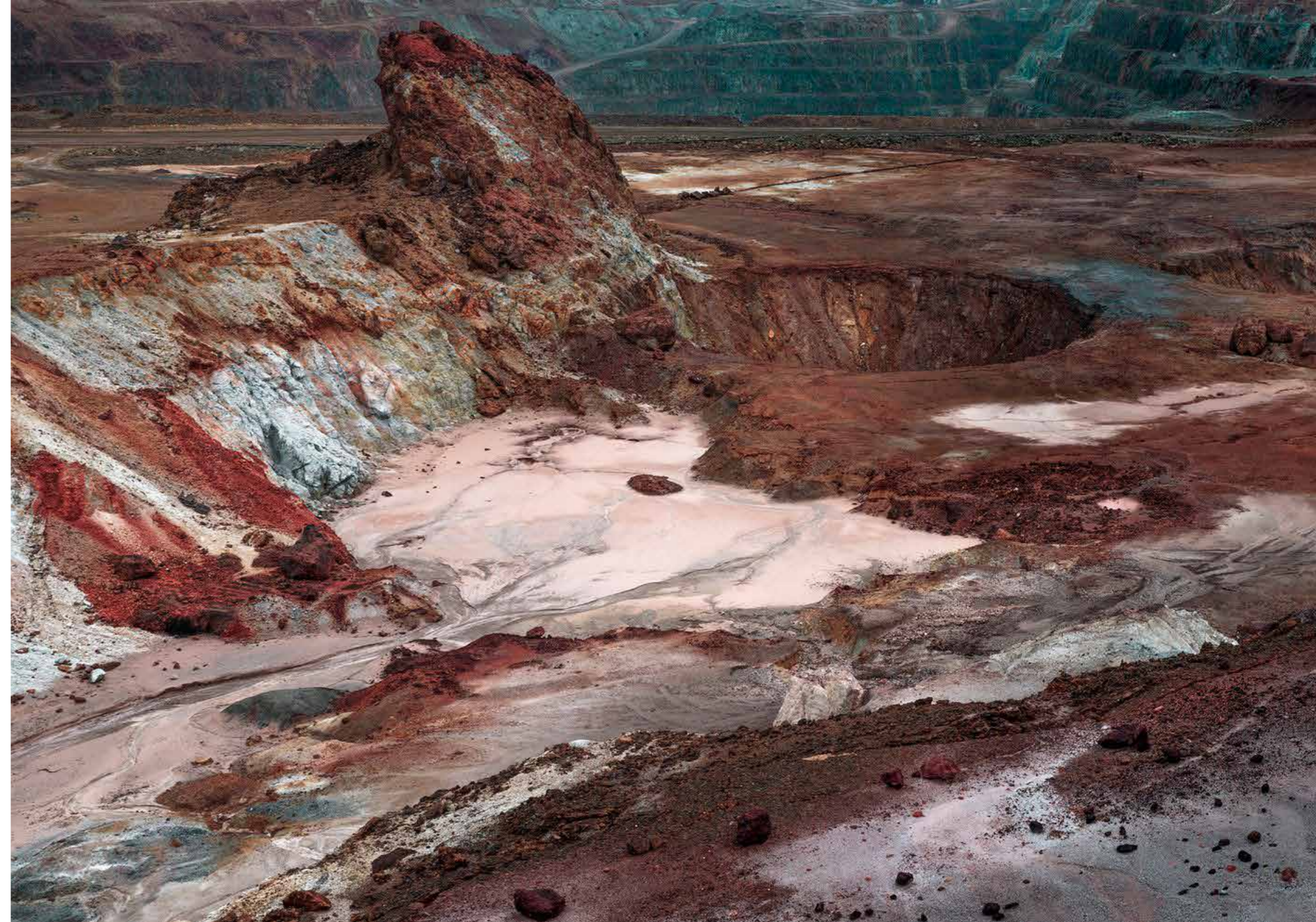
Hugo Deverchère Excavation#01, 2021 Tirage pigmentaire sur papier Hahnemühle Photo Rag Ultra Smooth 154 x 229 cm

HUGO DEVERCHÈRE • Dans le cadre du projet La Isla De Las Siete Ciudades présenté dans le jardin d'hiver, je me suis rendu en Espagne, le long du Rio Tinto, à la recherche de territoires qui ont été à l'origine de nombreuses cartographies mythiques du XVème siècle, comme celle de l'archipel des sept cités d'or. J'ai commencé par y prendre des photos. C'est avec la distance des images que j'arrive à m'appropriier les lieux. La photographie Excavation#01 fait partie de cette phase de recherche. On est face à la mine du Rio Tinto avec ses cratères formés par l'activité humaine d'extraction de minéraux. Une étrangeté se dégage très vite de l'image du fait de sa très haute définition et de son niveau de détail, qui ne correspond pas à la façon avec laquelle notre oeil perçoit habituellement le paysage. J'ai créé ce trouble en empruntant une technique utilisée en astrophotographie, qui consiste à combiner plusieurs centaines, voire milliers d'images pour parvenir à une sorte de vision surhumaine, plus proche de la machine et des outils scientifiques que de l'oeil humain. Le paysage devient plus réel que le réel : on en vient presque à douter de l'existence et de la réalité de ce qu'on est en train de voir. Cela m'intéressait dans le rapport à la fiction autour des histoires de l'archipel fantôme.